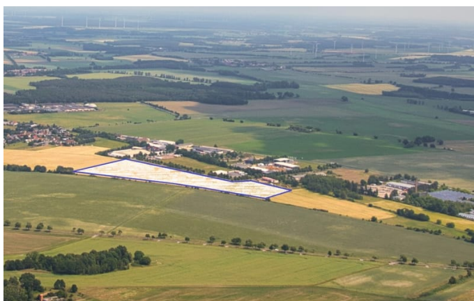
Klötze Poppauer Straße e.jpg